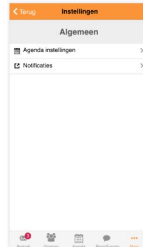
Afbeelding 8: Instellingen