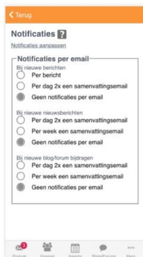
Afbeelding 9: Notificaties