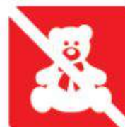
SPEELGOED & KNUFFELS